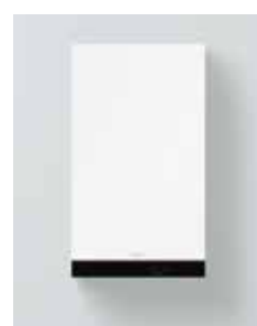
Vitodens 050-W (Modelo B0KA)

La Vitodens 050-W ha sido probada y homologada para gas natural según la normativa EN 15502. No es necesario un cambio dentro de los grupos de gas E/LL.