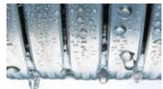
Intercambiador de calor Inox-Radial

El acero inoxidable marca la diferencia. El intercambiador de calor Inox-Radial de acero inoxidable resistente a la corrosión es la pieza clave de la Vitodens 050-W. Convierte eficazmente la energía utilizada en calor. Y lo hace con la seguridad de un acero inoxidable especialmente duradero y de alta calidad.