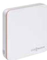
Termostato ViCare para más comodidad y eficiencia