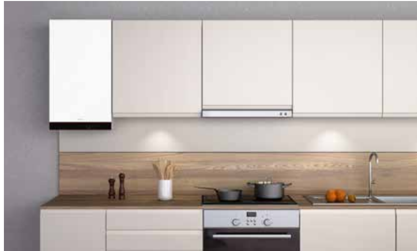
Vitodens 050-W con un atractivo diseño en color perla Vitopearl de Viessmann