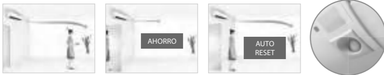
Función de ahorro energético gracias al sensor de movimiento.

La función human sensor detecta el movimiento de personas en la estancia y hace que el aire acondicionado funcione a menor potencia cuando se van de la habitación. Cuando la gente vuelve a la habitación el sistema regresa automáticamente a la configuración previa.