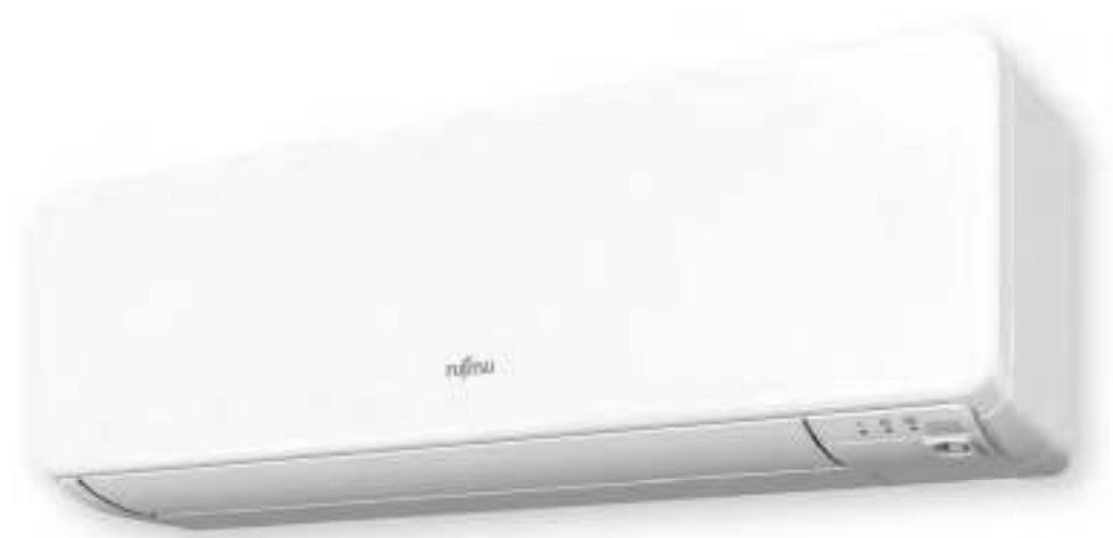
ASY 25-30-35-40 UI-KG